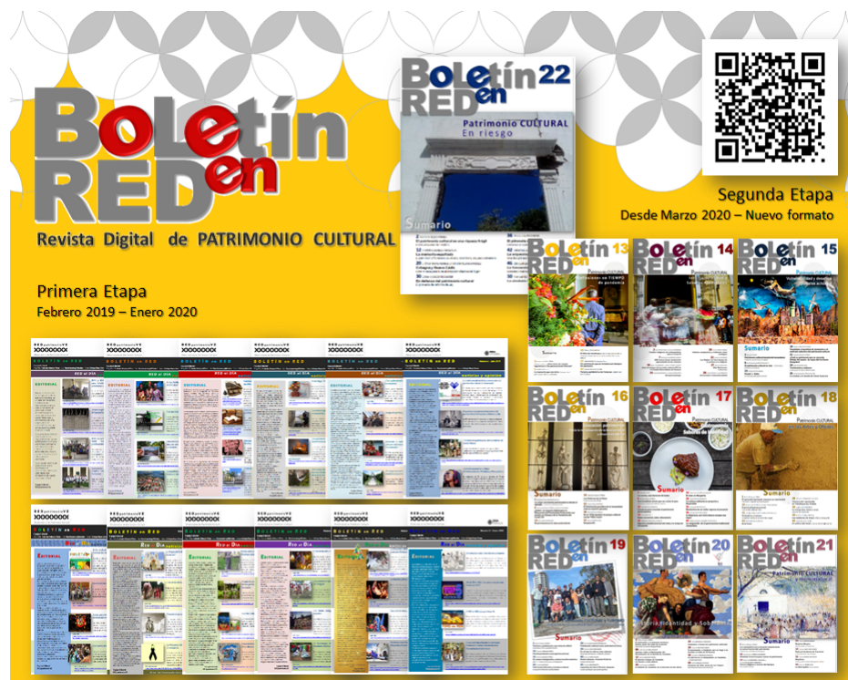
Figura 1: Portadas de las ediciones de la Revista Digital de Patrimonio Cultural BOLETÍN en RED

Como parte de las políticas de difusión del trabajo de los miembros de la Red, a principios del año 2022, se ideó otro proyecto editorial, el cual se ha denominado “Separata EDITORIAL de la Revista Digital de Patrimonio Cultural BOLETÍN en RED” que, tiene como objeto difundir contenidos únicos que ya han sido divulgados en las ediciones regulares de esta publicación, con la intención de promocionar y compartir el conocimiento fraguado e individualizado en esta materia por los miembros colaboradores de la REDpatrimonio.VE.