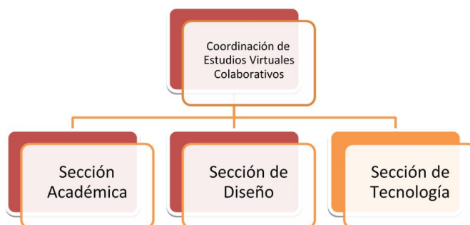
Figura 2: Estructura actual de la Coordinación de Estudios Virtuales Colaborativos.