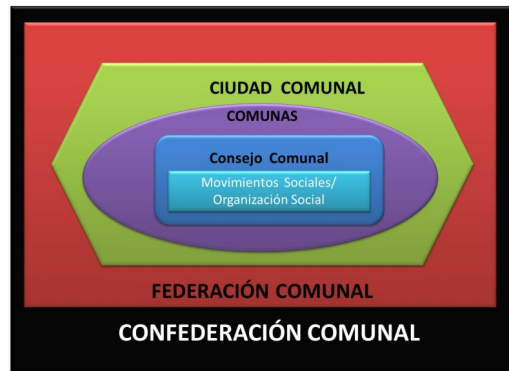
Figura 4: Sistema de Agregación de la Ley Orgánica de las Comunas

En las gráficas podemos apreciar los niveles jerárquicos del sistema de agregación comunal, que tiene implicaciones políticas y económicas en función a la transformación del Estado, en este sentido las formas de propiedad están íntimamente ligadas a las construcciones económicas alternativas, que posiblemente rompa con las ataduras del rentismo petrolero y la distribución equitativa de la riqueza, bajo esta perspectiva tener un crecimiento económico sin detrimento del crecimiento del beneficio social, disminución de la pobreza y diversificación de la economía.