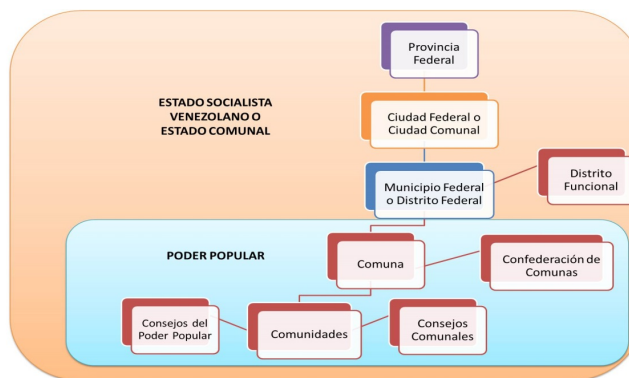
Figura 3: Estructura Territorial Propuesta en la Reforma Constitucional (2007)

En la propuesta de reforma constitucional (2007) se reconocía cinco formas de propiedad, como la propiedad privada, pero a su vez se construía nuevas formas de propiedad que permitiera en relación a lo político-económico enmarcarse a una nueva transformación de la actual infraestructura social y la construcción alternativa de las relaciones de producción. Es una tarea de la construcción comunal avanzar en ese sentido, como eje complementario de desarrollo de la comuna y el Estado Comunal o Socialista. La geografía juega un papel fundamental que va relacionado a los procesos de emitir un accionar de orden político-económico, que a su vez lleva implícito la comuna. En este sentido existe una relación de la infraestructura geográfica propuesta en la Reforma de la Constitución y su vinculación actual con los sistema de agregación definidos en la Ley Orgánica de las Comunas, porque en función a los cambios de la infraestructura geográfica, permitirá construir nueva institucionalidad que permita destruir de manera eficiente la actual forma de Estado burocrático y permita instituir una forma diferente y participativa de la sociedad en general.