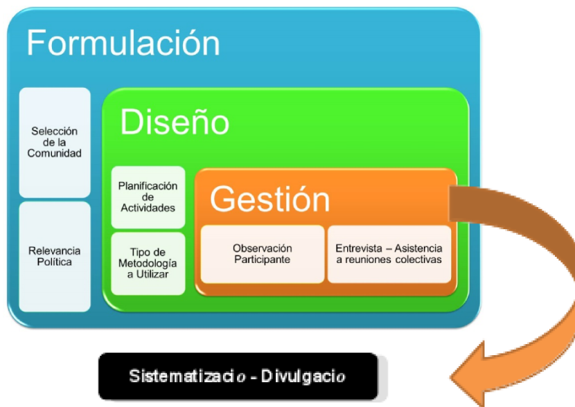
Figura 1: Diagrama del Diseño de Investigación en la Comuna Panapana Socialista.

El diseño realizado para llevar a cabo esta investigación reside en el seno de la Comuna Panapana Socialista y consta en el siguiente diagrama: