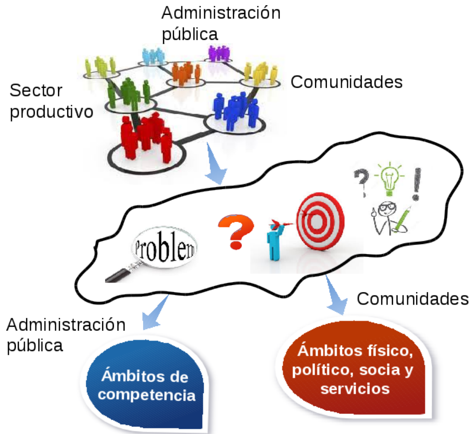
Figura 1: Proceso para la explicación de situaciones.

el ámbito social – prestación de servicios se indican problemas, metas y potencialidades con relación a la calidad de los servicios públicos con los que cuenta la comunidad.