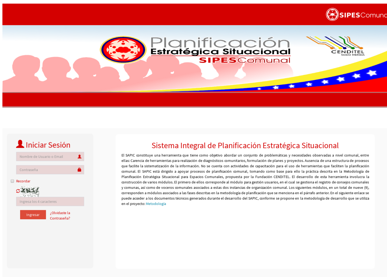
Figura 5: Página principal del SAPIC.