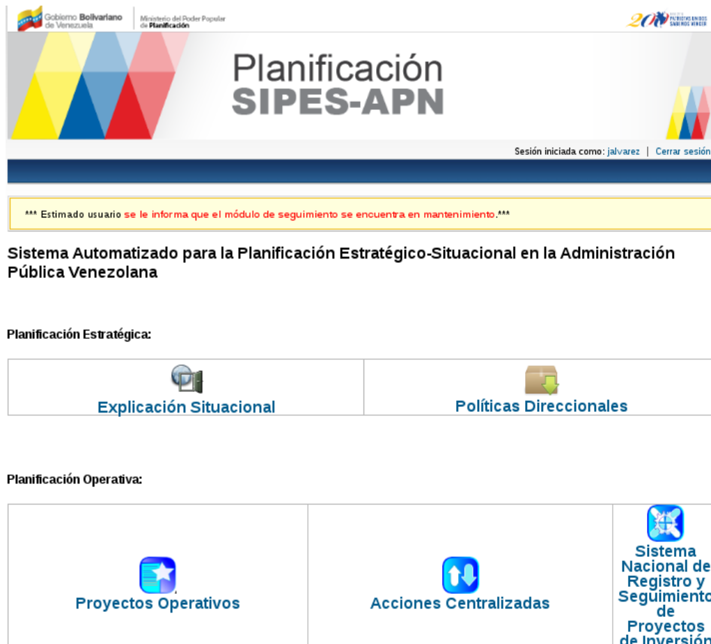
Figura 4: Página principal del SIPES-APN.