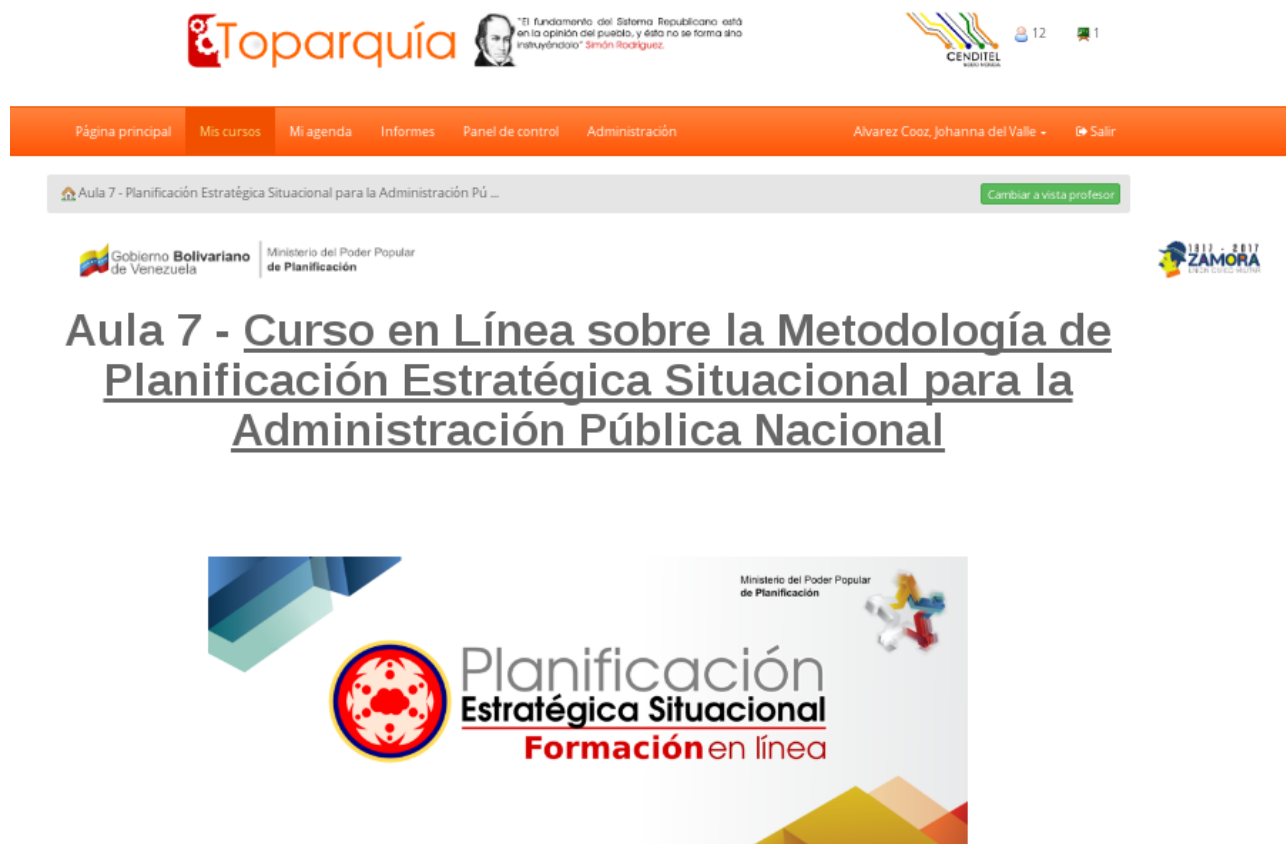
Figura 6: Página principal del curso sobre la Metodología de Planificación Estratégica Situacional para la Administración Pública.

entre el Estado y los sectores sociales que posibiliten la resolución de problemas comunes en colectivo (ver Figura 6).