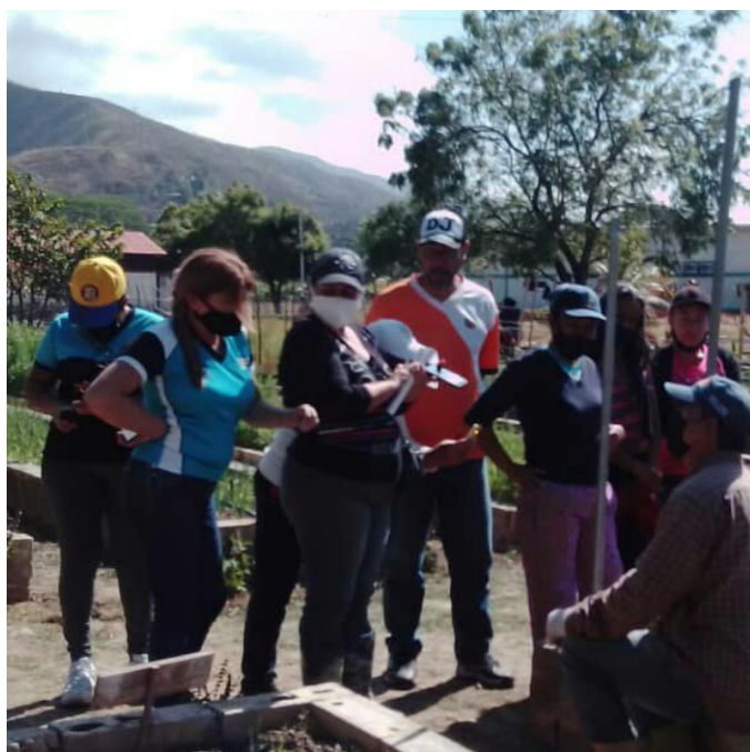
Figura 3. Explicando los procesos productivos.

Todo este proceso de enseñanza aprendizaje sistematizado y documentado se traduce actualmente en resultados concretos en la producción, demostrados en los cultivos de carácter vegetal y de hortalizas a ciclo corto, contando de igual forma con otros de tipo organopónicos, policultivos tecnificados, además de casas de cultivo y producción animal, estructurando también procesos formativos que dan respuesta a la producción en agrosistemas como semillas, bioinsumos y plántulas. También, se muestra un desarrollo político organizativo y productivo donde los activadores