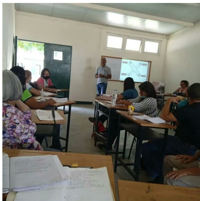
Figura 4. Procesos de Formación - NUFASIR.

Otra de las formas de multiplicar los resultados, es a través del “Sistema de Producción Pecuaria en Ganadería Menor” dirigido a la activación productiva