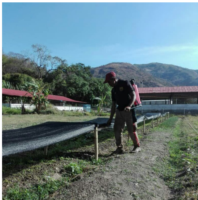
Figura 5. Riego de cultivos.

economías comunales, para promover la acción productiva en espacios que hasta hoy han sido desaprovechados.