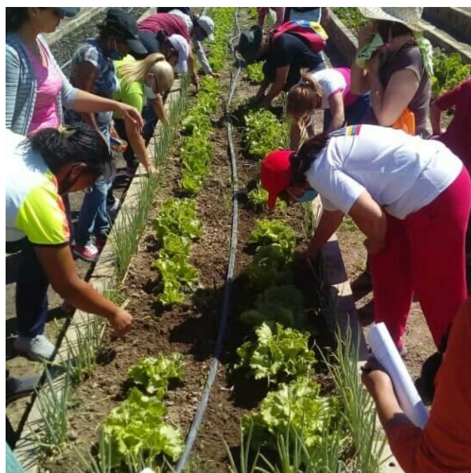
Figura 1. Trabajando en la cosecha.

Este proyecto tiene más de una década siendo ejemplo en la conformación de comunas agrícolas que apuestan y aportan desde el desarrollo productivo, social y formativo para promover la agroecología como ciencia que reconoce el rol e importancia de la tierra en armonía con el medio ambiente. En ese sentido, desde este centro de formación, se mantienen once (11) líneas de producción, tanto vegetal como animal, empleando el sistema de organopónicos como método de siembra de cereales, leguminosas, tubérculos,