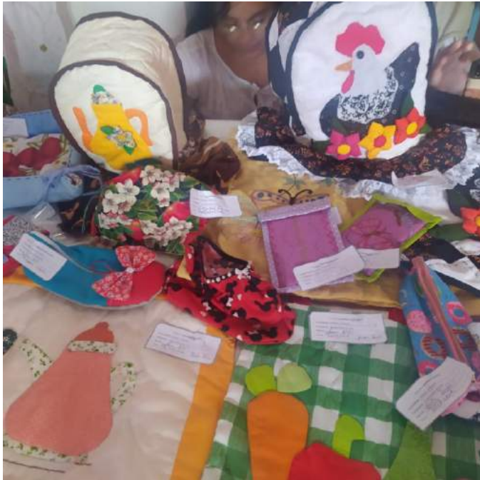
Figura 4. Producciones artísticas que tributan a la buena economía de la comunidades.

vida y constituyéndose como una palanca para el progreso económico, social y cultural del país.