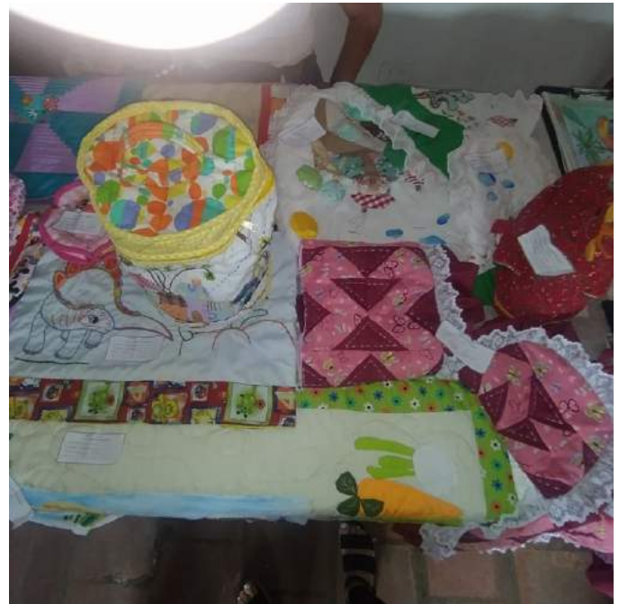
Figura 1. Arte y manualidades que favorecen el emprendimiento.

Actualmente, se desempeña como facilitadora de la distinguida Escuela de Labores Canónigo Uzcátegui ubicada en la ciudad de Ejido, en específico, en el populoso sector El Boticario de la parroquia Montalbán del municipio Campo Elías. Desde allí apuesta a través de sus cursos de adiestramiento y formación, a la creación de conocimientos que permitan a la población tener una oportunidad de emprendimiento de calidad que ayude a mejorar sus condiciones socioeconómicas.