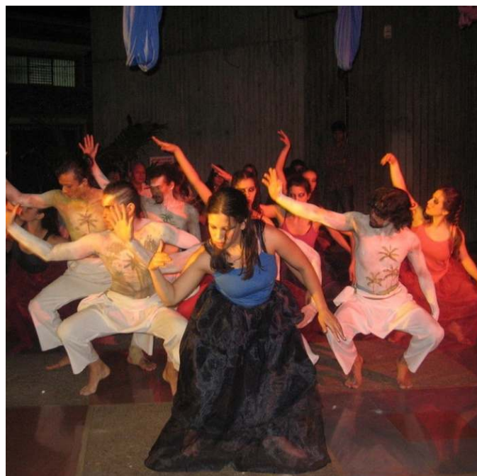
Figura 2. Obra "Reverón, Luz tras mi Enramada"

También, ha desarrollado el performance alrededor de la danza, con la creación de "Solos" cercanos a las artes plásticas y visuales (conjugando su formación como diseñadora gráfica). Se ha relacionado con museos de la ciudad (Casa Boset y Museo de Arte Moderno) para la apertura o inauguración de exposiciones, a través de puestas en escena, en acuerdo con el artista y el tipo de obras que presenta. En el escenario siempre toma en cuenta lo espacial, gráfico y visual para las creaciones de danza.