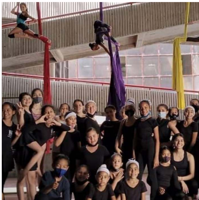
Figura 3. Acrotelas

Esta academia funciona en varios lugares de la ciudad, pues aún no cuenta con sede propia. Por ahora, la sede principal está ubicada en la Avenida 3, entre Calles 26 y 27, en un espacio llamado Casa de Arte (grupo infantil). También, desarrollan actividades en UNEARTE (grupo juvenil y adulto contemporáneo) y en el Centro Cultural "Don Tulio Febres Cordero" (grupo de acrotelas).