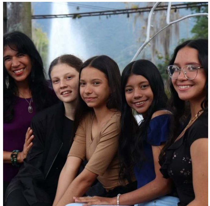
Figura 4. Formación infantil y juvenil

En cada clase tienen una primera parte de preparatoria física, luego practican por ejemplo, Ballet y Danza Contemporánea o Latino y Urbano. Así, van formándose en las partes básicas de cada disciplina. Luego en una tercera etapa, los bailarines van definiendo si se van por lo Latino, Contemporáneo o lo Gimnástico; y se le aumenta el tiempo de entrenamiento especializado a tres horas.