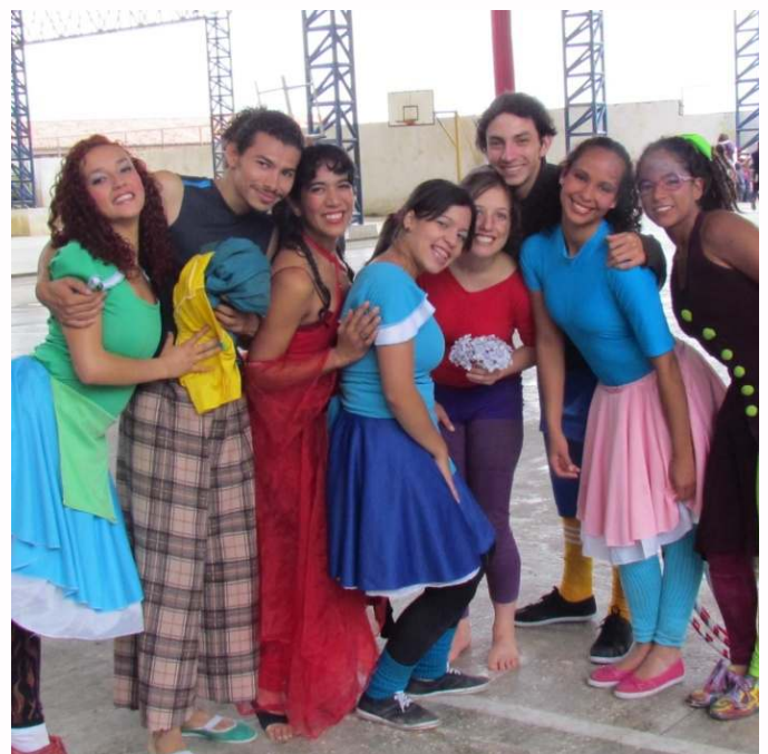
Figura 7. Presentación en espacios múltiples

Hace años presentaban proyectos y tenían apoyo logístico, a través de convenios con organismos del Estado como: el Sistema de Culturas Populares y con el Consejo Nacional de Cultura (CONAC), actualmente Ministerio de Cultura, lo cual les permitió presentarse en varios pueblos del páramo merideño, de difícil acceso. Después, aunque no se encontraban activos esos convenios se hizo el esfuerzo por continuar compartiendo la danza en los Pueblos del Sur y en el páramo. Actualmente, se han concentrado solo en la ciudad de Mérida, debido a diversas dificultades económicas para cubrir gastos de traslado y logística, ya que solo cuentan con los recursos derivados de su autogestión para los pagos esenciales (espacios, mantenimiento, vestuario, servicios, entre otros).