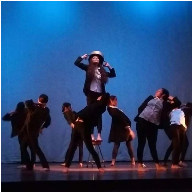
Figura 9. Proyecto Claveles Fuente: SOBREPiEDi (2022)

Además, a través de la Compañía SOBREPiEDi debido a su larga trayectoria ha permitido la proyección nacional e internacional, pues forma parte de la Red Latinoamérica Pro Niñez, conformada por maestros de danza de cinco países (Venezuela, Colombia, Ecuador, Perú y Chile) donde han conformado un colectivo para trabajar en proyectos de formación, educación y comunidad infantil hacia la difusión de la danza.