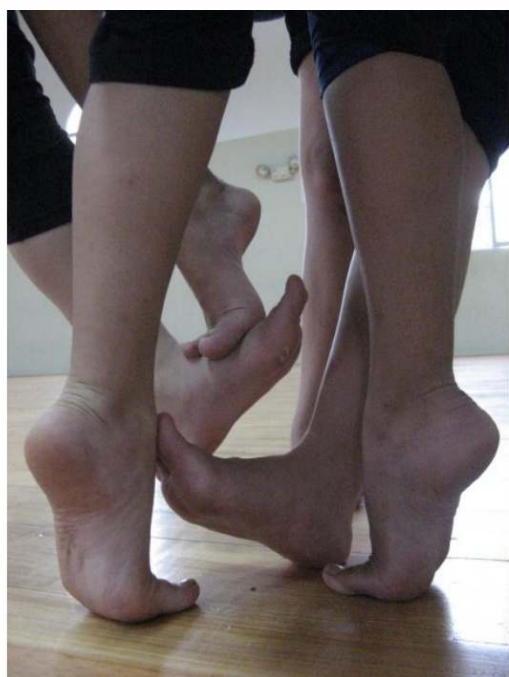
Figura 5. Piso adecuado para la danza

La principal dificultad que enfrentan es el espacio, debido a que como se mencionó anteriormente no cuentan con una sede propia. Cabe resaltar que la práctica de la danza requiere un piso adecuado (con una base que provea una adecuada amortiguación, cámara de aire) para reducir el riesgo de lesiones en los bailarines. En la ciudad de Mérida, únicamente hay tres espacios que cuentan con este tipo de piso Escuela de Música de la ULA, UNEARTE y un salón en el sector de Campo de Oro. Debido a esto, van alternando los espacios con los que cuentan, para desarrollar la danza de la mejor manera, y evitar en lo posible que los bailarines practiquen en espacios no adecuados.