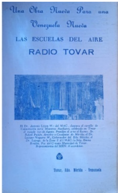
Figura 2. Las buenas noticias

La amplia aceptación del campesinado y el apoyo económico de muchas instituciones y organizaciones internacionales, hicieron posible el proyecto. La meta fue la culturización en el sentido más amplio de la palabra ya que la alfabetización fue un paso previo, imprescindible, para las etapas que estaban por venir. El 16 de diciembre de 1956, en Canaguá, estado Mérida, nació la primera institución de educación a distancia en Venezuela.