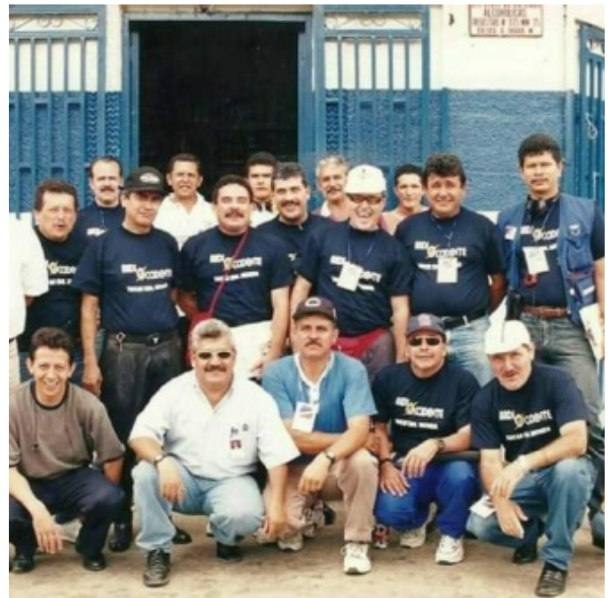
Figura 7. Pionera en transmisiones de ciclismo

En el ámbito informativo Radio Occidente a lo largo de su historia le ha dado importancia a los espacios