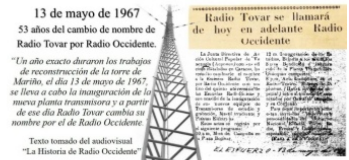
Figura 3. Somos Radio Occidente 1100 AM