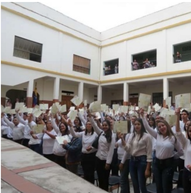
Figura 5. Logro alcanzado, egresados radiofónicos

transmisiones, a las diversas actividades deportivas, convirtiéndose de esta manera, en una escuela en la formación de narradores y comentaristas en las distintas disciplinas deportivas formales y populares. Ha estado presente en el desarrollo progresivo del Valle del Mocotíes, de los Pueblos del Sur del estado Mérida, zona sur del Lago y de la zona norte del estado Táchira. Además posee una programación dedicada a los niños, puesto que es un público muy importante al cual hay que atender.