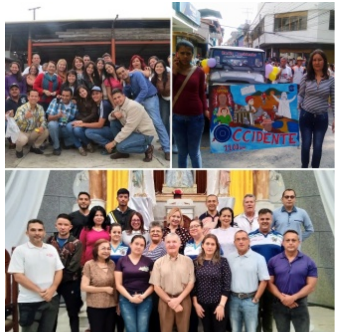
Figura 8. Familia Radio Occidente

Correo electrónico: molinarellano56@gmail.com