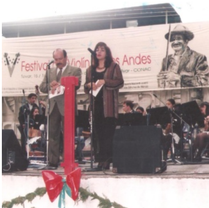
Figura 6. Radio Occidente, génesis del Festival del Violín de Los Andes

Silguero estaba convencido que el pueblo necesitaba aprender un oficio, porque aún cuando la Unidad Educativa “Adultos por Radio”, para entonces, formaba