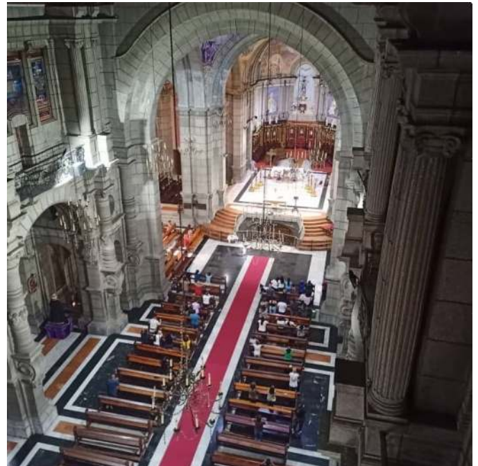
Figura 2. Vista aérea de la nave principal

Está formada por una planta en forma de cruz latina, con cinco naves y una gran cúpula. En la nave central su techo es a dos aguas y los laterales están cubiertos por bóvedas, una cúpula central y seis cupulines.