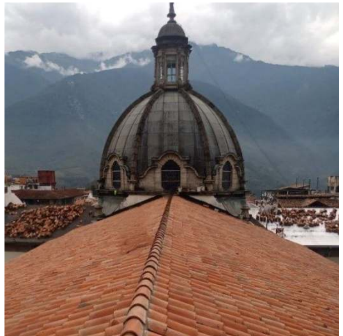
Figura 6. Techos de la Catedral, al fondo se visualiza el retiro de las tejas