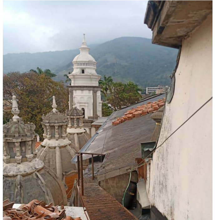
Figura 5. Cupulines antes de restaurar y techos al retirar tejas para realizar la impermeabilización y restauración