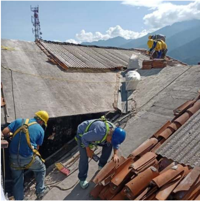
Figura 9. Personal colocando teja e impermeabilizando

Es de hacer notar que durante todos estos trabajos se ha tratado de mantener la integridad de las tejas las cuales forman parte de ese patrimonio histórico, realizando diferentes tratamientos para conservarlas, así como también de las losas de techo y de los vitrales, dicho trabajo se detallara a continuación a través de la entrevista realizada a Rocío Mora.