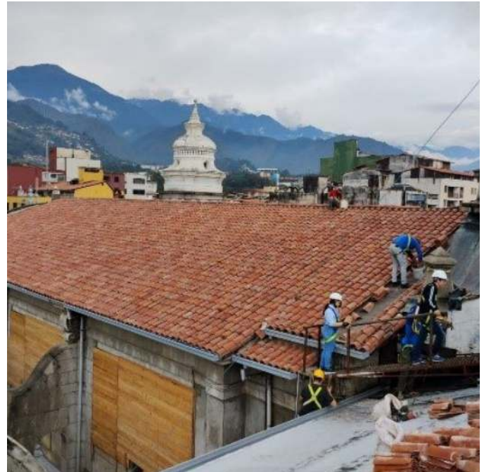
Figura 8. Personal especializado restaurando los techos