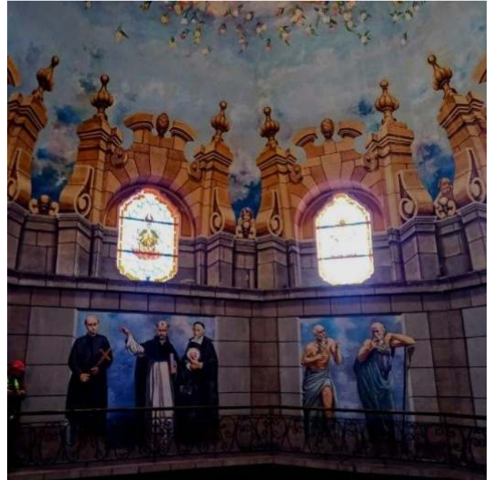
Figura 12. Vitrales internos en proceso de restauración

Todo esto ha sido gracias al trabajo en conjunto realizado con Enrique Arias, quien es el responsable del trabajo de herrería, en cuanto a desinstalar, instalar y ajustar lo que se requiera según cada pieza trabajada. Nos indica Rocío Mora que se podría incluir más personal pero siempre está el temor de la manipulación de las piezas, por esta razón se ha decidido trabajar con el mínimo necesario, para lograr cada restauración de manera óptima y lo más importante conservar el diseño original y no perder la condición de patrimonio que tienen las estructuras.