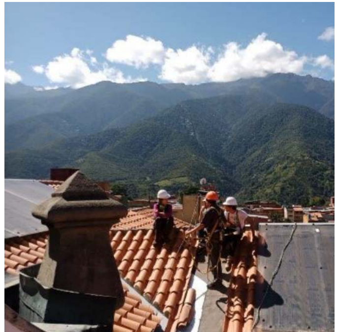
Figura 10. Techos de los vitrales restaurados

También se realizó la rehabilitación de varias piezas decorativas (una de ellas se había desprendido), para poder brindar seguridad en la nave central se aseguraron todas las que tenían condiciones similares a esta, incluyendo un tensor que es imperceptible al ojo humano pero que brinda seguridad a todas las personas que asisten a este majestuoso espacio.