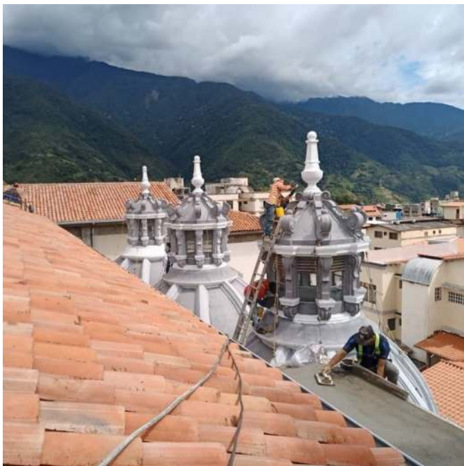
Figura 7. Personal (al fondo) bajando uno de los vitrales, (derecha) pintando los cupulines, (al frente) dando acabado a una losa

El plan busca recuperar el casco histórico de la ciudad promoviendo el turismo y así realzar todos sus maravillosos espacios, para el disfrute de los habitantes y visitantes. 3