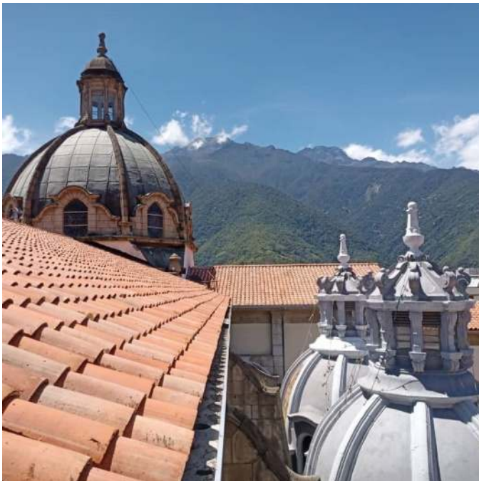
Figura 3. Techos, cúpula y cupulines