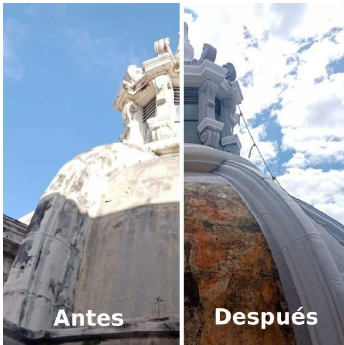
Figura 14. Antes y después de la restauración, posible Escudo de Mérida

Al momento de la restauración de los cupulines, (previamente a ello se protegieron con tablas para garantizar su integridad física), se hizo necesario remover las diferentes capas de pintura y asfalto que se habían ido incorporando al pasar de los años en cada intervención y actualmente, gracias a la tecnología existente, se le agregó pintura elastomérica que cuenta con colores congruentes con la imagen estética de la edificación, además de cumplir con la impermeabilización de las superficies, esencial para la restauración.