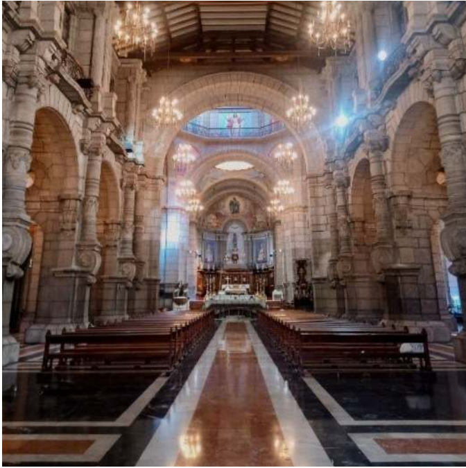
Figura 3. Vista de la nave central