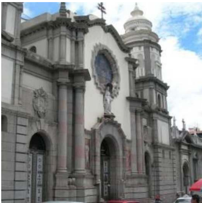
Figura 1. Fachada de la Catedral de Mérida

En 1980 según Gaceta Oficial N° 32.039 es declarada Patrimonio Nacional y en 1991 elevada a Basílica Menor por su Santidad el Papa Juan Pablo II.