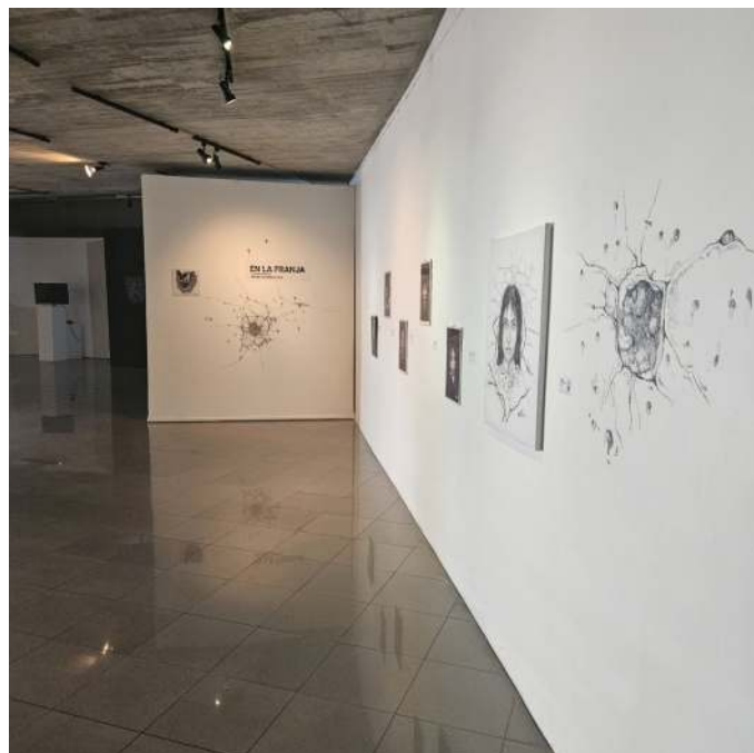
Figura 3. Sala César Rengifo, exposición "En la franja" de Miguel Albornoz

identidad". De este modo, el museo no se limita a la exhibición de obras plásticas; también es un espacio interdisciplinario donde se desarrollan actividades que acercan el arte a diferentes públicos. A través de recitales de poesía, performances y debates, el museo se convierte en un lugar de encuentro para la comunidad, donde el arte y la cultura son herramientas de transformación social.