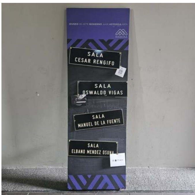
Figura 2. Distribución de las salas del Museo de Arte Moderno Juan Astorga Anta

Este cambio no solo respondió a la necesidad de un espacio accesible para los visitantes locales e internacionales, sino también a la intención de proporcionar un entorno adecuado para el resguardo y exhibición de su valiosa colección de obras de destacados artistas. Patiño hace hincapié en que el traslado al centro de Mérida facilitó una mayor accesibilidad: "Cualquiera que esté en la Plaza Bolívar puede venir a este museo... una ruta céntrica para poder darle movilidad".