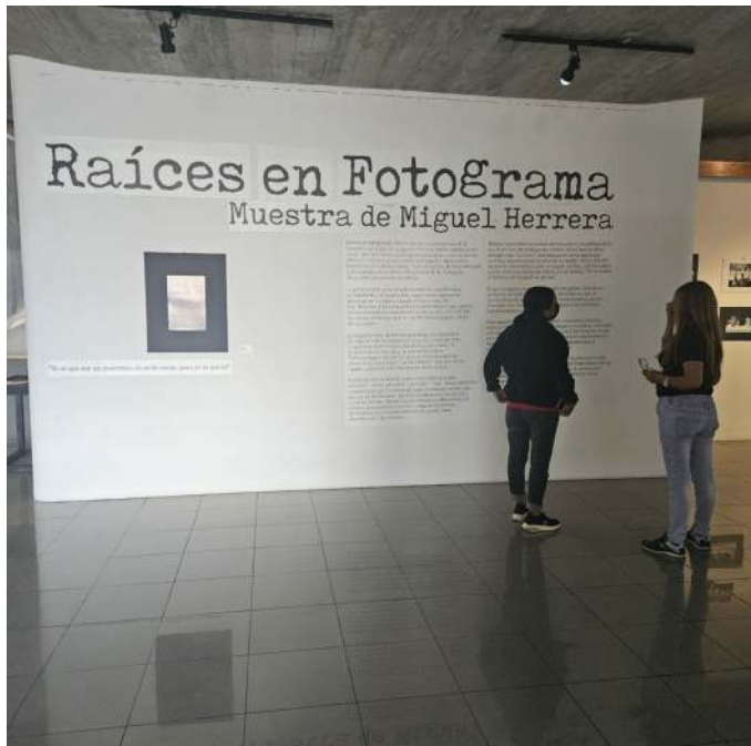
Figura 4. Sala Oswaldo Vigas, muestra "Raíces en Fotograma" de Miguel Herrera

En este momento, en la Sala César Rengifo se presenta la exposición "En la franja" de Miguel Albornoz, una reflexión plástica sobre la situación en Gaza. En la Sala Oswaldo Vigas, la muestra "Raíces en Fotograma" de Miguel Herrera explora la identidad venezolana, mientras que en la Sala Elbano Méndez Osuna, Herrera ofrece una visión contemporánea de la Batalla de Carabobo con "Carabobo, una mirada contemporánea". Finalmente, la Sala Manuel de la Fuente exhibe obras de diversos artistas, complementadas con prácticas y ensayos culturales.