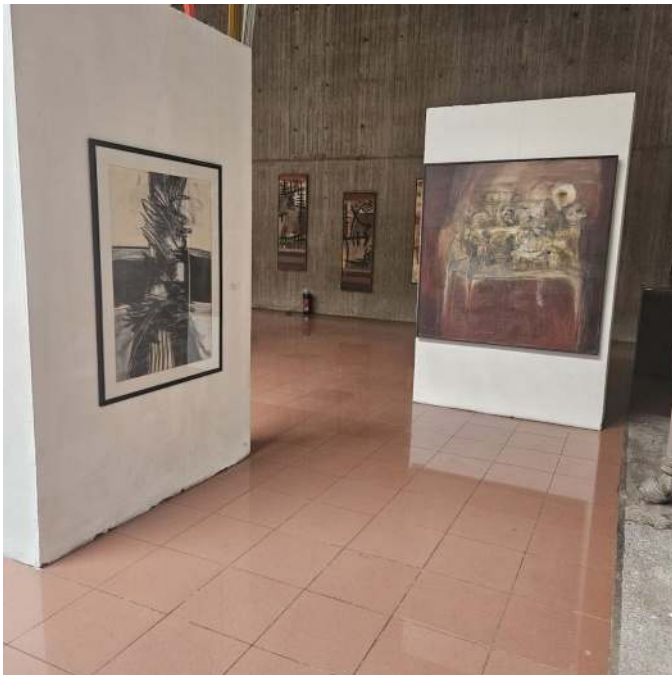
Figura 6. Sala Manuel de la Fuente, ostenta obras de diversos artistas

Asimismo, se realizan inventarios periódicos y un mantenimiento constante para asegurar que las obras se conserven en condiciones óptimas. Señala Patiño “es una manera de contraloría, desde bienes, para ver si están las obras y cómo están. Ante cualquier percance, éste debe ser anunciado con tiempo para nosotros poder, a través de la conservación patrimonial, estar atentos”. Este compromiso permite que piezas valiosas de artistas como César Rengifo, Oswaldo Vigas y Gego sigan siendo accesibles para futuras generaciones.