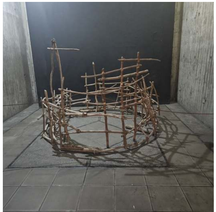
Figura 7. Escultura “Corral y Dormitorio” de Franco Contreras en exposición permanente Fuente: María Eugenia Acosta (2024)

Además, Patiño añade que “el museo es un espacio donde se pueden planificar actividades culturales y también es un espacio para la investigación, hay una biblioteca”. Esta afirmación resalta la multifuncionalidad del museo como un lugar para la apreciación del arte, la educación e incluso para la investigación cultural.