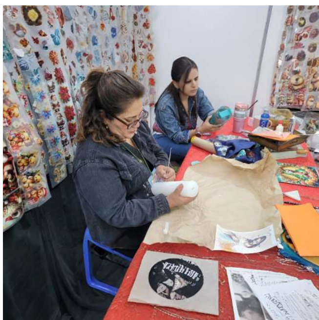
Figura 9: Taller de preparación de velones

Esta es una de las características que señalan su potencial en talleres formativos, proyectos creativos de redes de emprendimiento o iniciativas basadas en la comunidad para unir el arte y la sustentabilidad. “La experiencia es susceptible de sistematización”, asegura, confiando en que la llama de su arte puede encenderse en muchas manos.