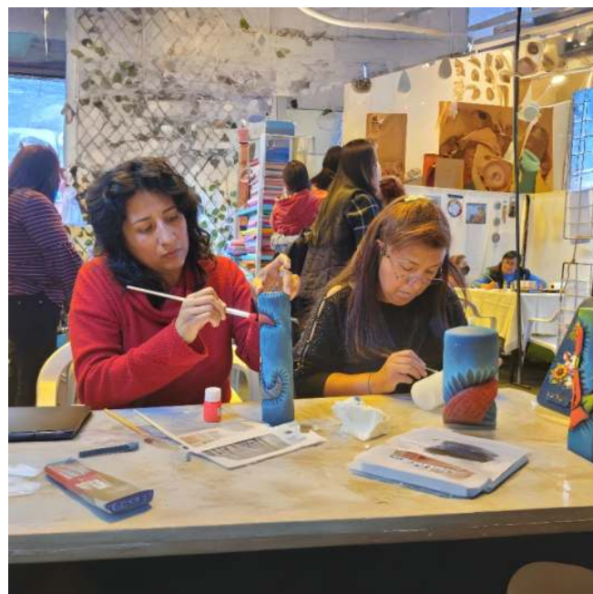
Figura 5: Proceso de pintado y acabado del tallado de velones