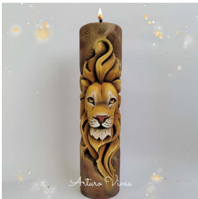
Figura 3: Tallado en vela