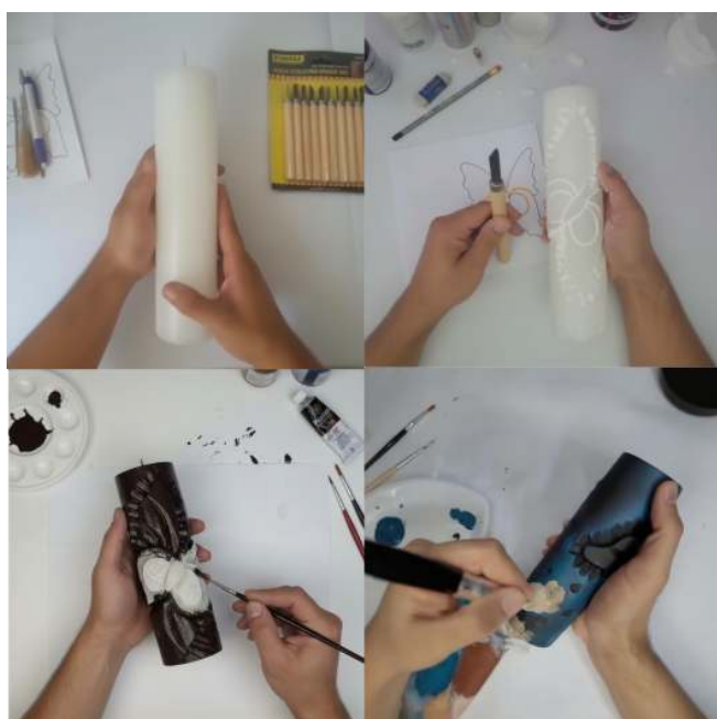
Figura 4: Proceso inicial de tallado de velones