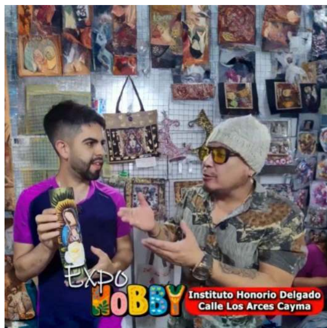
Figura 10: Presentación en TV internacional de las obras

La obra de Arturo Vivas ilumina más allá del resplandor de una llama. Cada velón tallado habla de resistencia, de belleza hecha a mano, de un diálogo constante entre lo ancestral y lo contemporáneo. Su proyecto nos recuerda que el arte no siempre está en los grandes museos o galerías, sino también en los objetos cotidianos que, transformados por la creatividad, nos conectan con lo esencial.