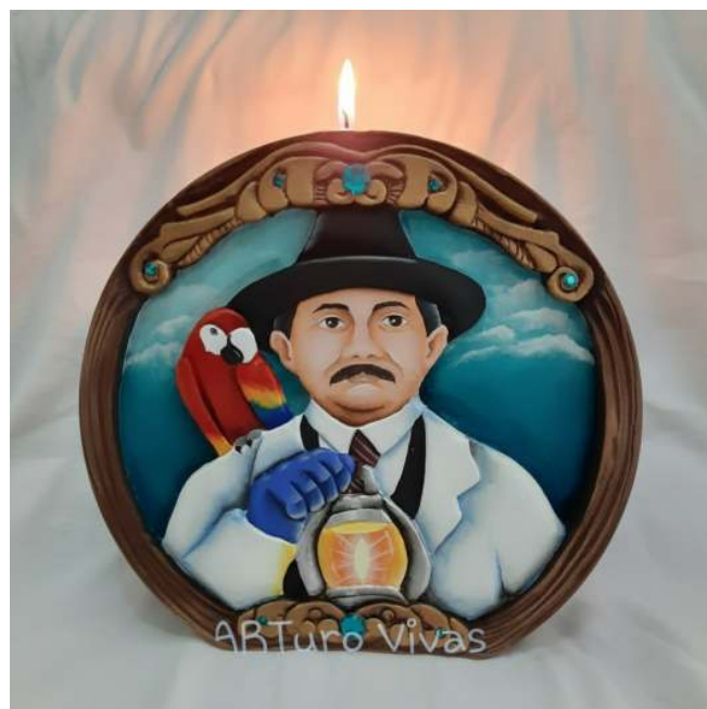
Figura 2: Tallado en vela

Desde hace más de una década, Arturo encontró en la cera un soporte noble y versátil, capaz de sostener no solo formas escultóricas, sino también emociones. Hoy su proyecto de velas talladas trasciende lo decorativo: es un puente entre lo ancestral y lo innovador, un gesto de resistencia cultural en tiempos tecnológicos. En base a esto, Arturo comenta que: “Vi en la cera un material noble y versátil, y decidí unir técnicas de escultura con el ancestral encanto de la vela”.