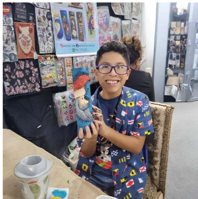
Figura 8: Participantes de diferentes edades

En cada taller, niños, jóvenes y adultos desarrollan motricidad, creatividad y trabajo en equipo. No son solo aprendizajes técnicos, sino también espacios de encuentro y pertenencia. “El interés constante, la continuidad de los talleres y la réplica de la técnica en otros espacios evidencian un efecto positivo y sostenible”, comenta con orgullo.