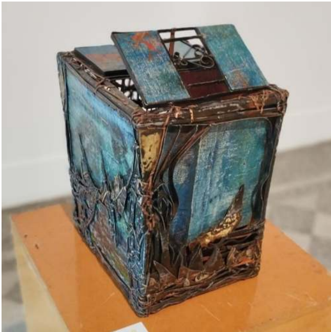
Figura 12: La caja azul

pequeños dioses, que crean sus propios mundos, con una cosmovisión personal”.