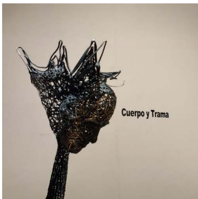
Figura 5: Galería la Otra Banda, muestra Cuerpo y Trama

En esta amalgama de elementos y recursos plásticos destacamos la serie de los “Animales Imaginarios”.