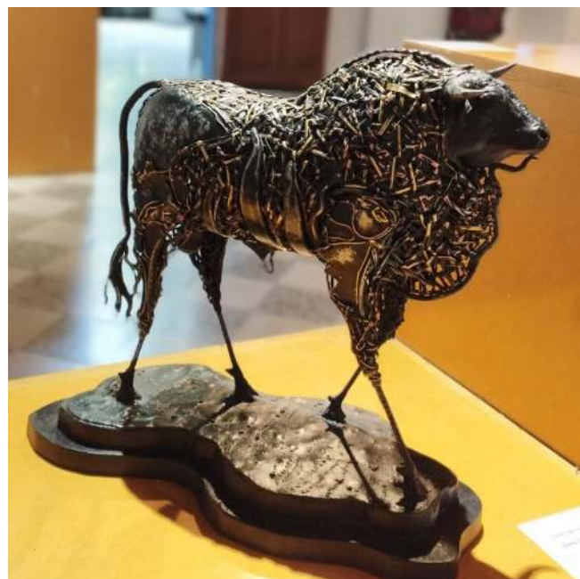
Figura 9: Serie Tejidos (Toro)

Observar algunas de las piezas nos remite a elementos presentes en la cestería tradicional, también a arquetipos culturales ancestrales. La verticalidad presente en la estructura compositiva marca la mayoría de estas esculturas.