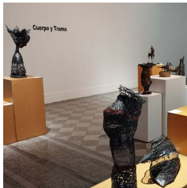
Figura 1: Exposición Cuerpo y Trama, Galería La Otra Banda

calle, de otros amigos, de otros compañeros, y esa experiencia fue muy enriquecedora”.