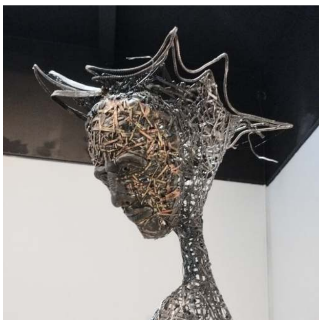
Figura 10: Serie Tejido, Detalle Fuente: Miguel Albornoz (2025)

Hay partes de la escultura que están moldeadas en metal con un estilo realista, combinadas con la trama tejida, presente en las piezas descritas anteriormente. Las extremidades del animal están exageradas cual si fueran prótesis que alargan sus patas, dándole elegancia a la forma. Hay partes soldadas y también ensamblaje de piezas recicladas de objetos metálicos y mecánicos. Al igual que las obras de estilo abstracto David aplica pátinas y esmaltes de color, armonizando con los colores propios del metal, que en algunas zonas queda al desnudo sin tratamiento o simplemente lijado. En estas obras se destaca una paleta de colores cálidos.