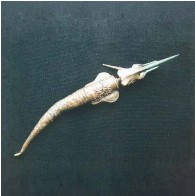
Figura 3: Pieza de Orfebrería

Luego se encuentra con la orfebrería a través de algunos cursos que realiza junto a su compañero de trabajo, aprendiendo otra forma de expresión, esta vez con la manipulación de metales. A través del moldeado, recocido, cincelado, repujado y forjado