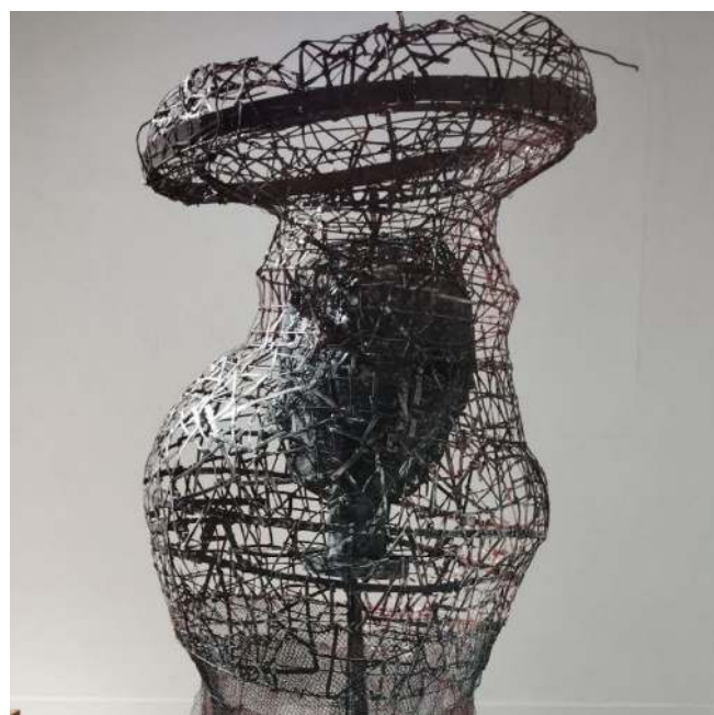
Figura 11: Serie Tejidos

los rasgos mas significativos, con un acabado esquemático no realista. Aquí percibimos una obra conformada entre una mezcla de elementos abstractos y figurativos. Esta relación le da a la obra una carga subjetiva y simbólica mayor, en contraposición a las que conforman las series de orden abstracto. Para David estas esculturas representan la angustia del hombre contemporáneo, su incertidumbre, producto de la ruptura de paradigmas sociales y económicos, también al hombre atrapado o desplazado por conflictos bélicos.