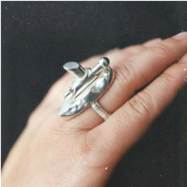
Figura 2: Pieza de Orfebrería “Submarino”

desarrollando su creatividad al diseñar gran variedad de piezas artesanales.