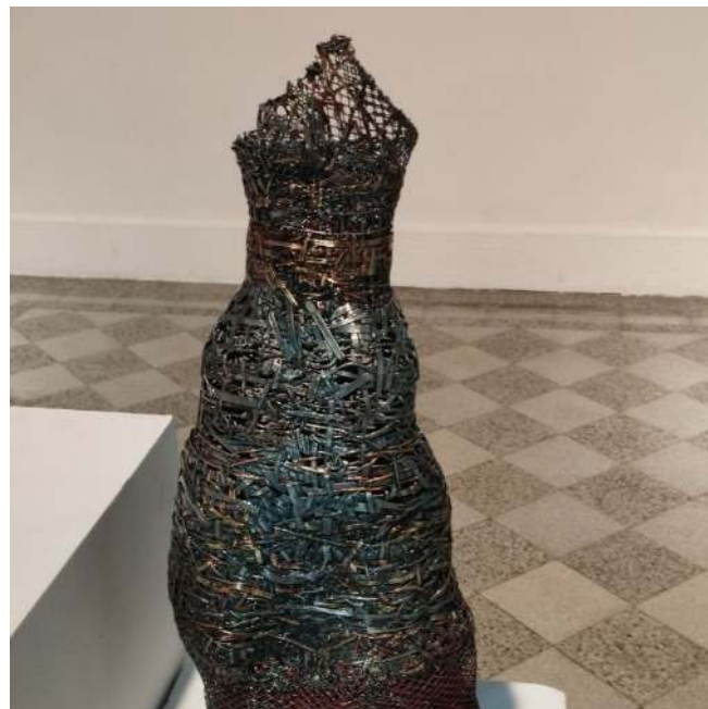
Figura 6: Serie Tejidos, Cesta (01)

allí en cada una de ellas están presentes los elementos que gracias a la experimentación, manipulación y comprensión, tanto de los materiales como de los instrumentos, se ha concretado en hallazgos artísticos, que impregnan cada obra de un sentido estético y simbólico. La exposición esta conformada por 12 esculturas de orden abstracto y figurativo, en algunas piezas se combinan estas dos condiciones.