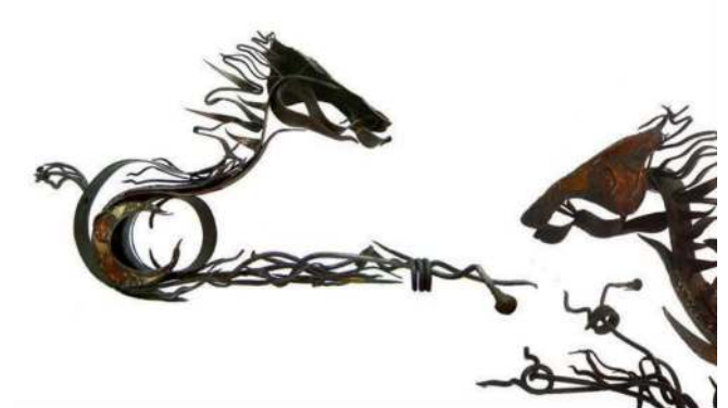
Figura 4: Escultura Caballo Urbano 001. Imágenes de la maqueta