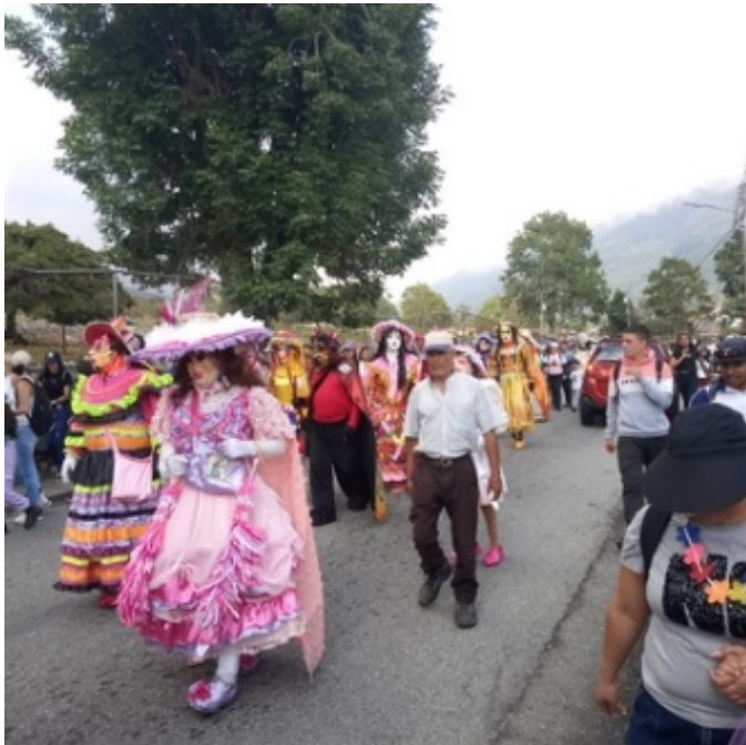
Figura 5. Procesión de disfraces junto a devotos y público en general

El punto de partida es en la capilla de La Candelaria, en el Arado B, donde se da inicio a la Eucaristía (misa) a las 6:00 a.m.; luego de concluida la misma a las 7:00 a.m. se baja por la vía principal hasta llegar al sector San Javier del Valle, una vez allí congregados los Locos junto con la imagen de la Virgen reciben el apoyo de camiones y otros vehículos para ser trasladados hasta el sector Alto de Monterrey, donde se visitan varias viviendas, se hacen los bailes correspondientes y luego se abordan los camiones para descender a Monterrey Bajo.