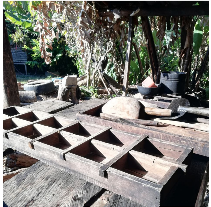
Figura 9. Moldes para elaborar la panela