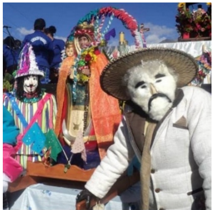
Figura 10. El viejo y la vieja junto a la imagen de la Virgen de Candelaria en la procesión

En este orden de ideas, los personajes o disfraces que representan mayor autoridad en la fiesta, sin duda son el viejo y la vieja , son quienes determinan el recorrido y marcan la pauta en el marco de la veneración.