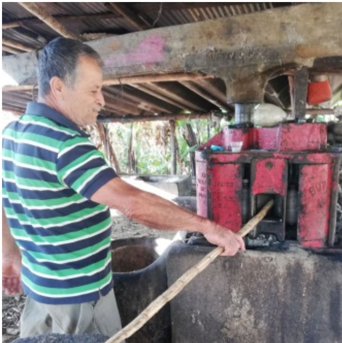
Figura 5. Molida de la caña

En el caso de la panela, al dar el punto de espesor, se va vaciando el contenido en una canoa y luego en unos moldes de madera, donde se dejan secar durante