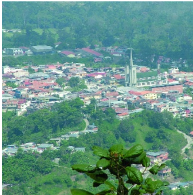
Figura 1. Vista del pueblo de La Azulita

su casa materna tenían un trapiche, su padre Víctor Marquina molía caña y le enseñó, junto a sus hermanos, este laborioso proceso que parte desde la siembra de la caña, su corte, molienda y elaboración de derivados como el guarapo, la miel, la melcocha, la panela y la melaza.