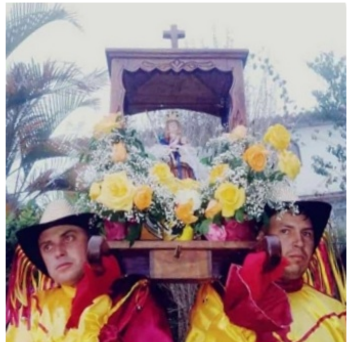
Figura 6. Veladores de la imagen de la Virgen de la Candelaria

continuando su recorrido a los sectores Las Cuadras, La Carbonera, El Hueco, El Pajonal y Camellones, hasta finalmente regresar a la capilla de La Candelaria en El Arado A. Durante todo el recorrido, la imagen de la Virgen de la Candelaria es llevada por los denominados veladores, quienes sostienen la imagen durante toda la jornada. La festividad cierra en horas de la noche cuando todos los participantes se quitan las máscaras, quedando al descubierto quien interpreta a cada personaje de la comparsa.