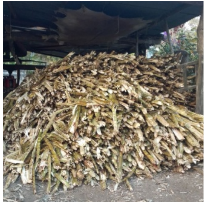
Figura 6. Bagazo de la caña

Por otro lado, la Melaza es una especie de espuma que va saliendo a medida que van cocinando, la van retirando y la usan como alimento para las vacas. Generalmente se extrae cuando la caña es fina.