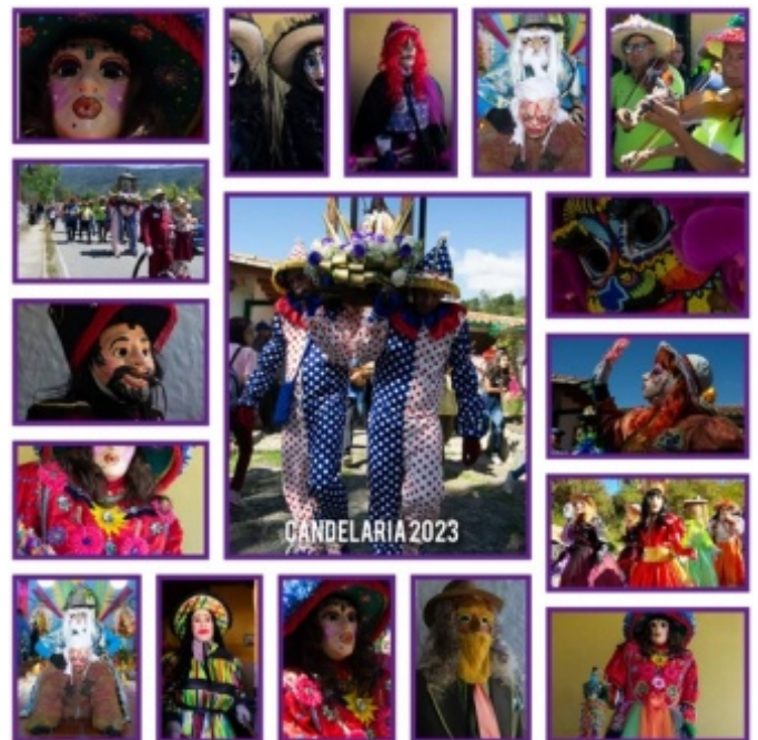
Figura 8. Gama de disfraces utilizados en la festividad del año 2023

Una de las características fundamentales de esta manifestación cultural es que todas las personas que participan y se disfrazan son hombres, esto se debe a las exigencias físicas que amerita toda la jornada. Los disfraces o caracterizaciones de los personajes están jerarquizados y se dividen en dos grandes grupos: disfraz por dentro y disfraz por fuera. El grupo que constituye el disfraz por dentro se refiere a todos aquellos quienes presiden las actividades: el viejo, la vieja, primer capitán, segundo capitán y las denominadas muchachas. Y el grupo que conforma el disfraz por fuera está constituido por las denominadas carolinas, payasos, el brujo, la bruja, el indio, la india, los cazadores, el médico y la enfermera; son todos los demás personajes restantes que se desenvuelven en la fiesta, son los disfraces encargados de realizar los bailes en cada una de las casas visitadas.