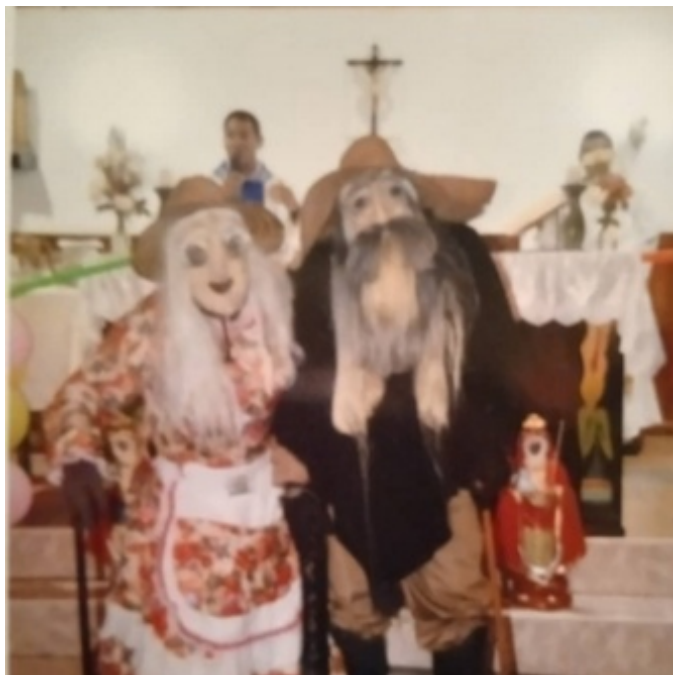
Figura 11. Disfraces de el viejo y la vieja del año 2024, en la iglesia de San Isidro Labrador de El Valle

Es denominada también “mini-Candelaria”, es la versión infantil de la fiesta de la Virgen de la Candelaria. En este caso participan niños en edades comprendidas entre 5 y 15 años y se celebra el domingo de la siguiente semana del 02 de febrero. En esta manifestación se ejecutan los mismos bailes que realizan los participantes adultos, manteniéndose la mayor parte de los disfraces. Son una suerte de escuela de iniciación para la participación posterior en la fiesta de adultos, de tal manera que cada participante a partir de los 16 años entraría a formar parte de la festividad de los Locos de la Candelaria en su versión de adultos. En principio, esta manifestación era realizada por alrededor de 6 o 7 personas dentro de un terreno o potrero; posteriormente se incorporan más personas y se establece un recorrido saliendo de dicho terreno hasta sectores aledaños.