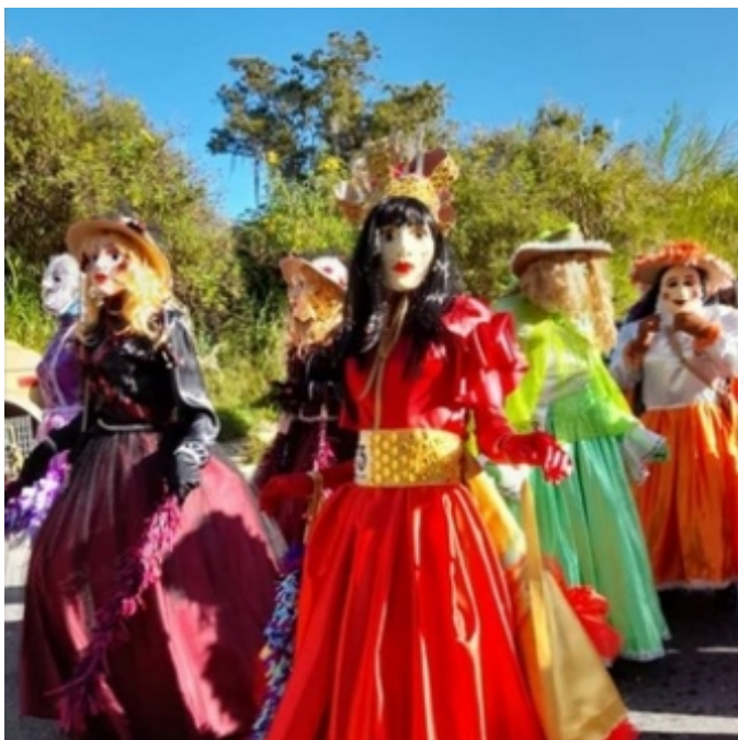
Figura 13. Disfraces de las muchachas

La función de la junta directiva es velar por el correcto desenvolvimiento de la fiesta, garantizar que se cumpla la tradición en forma cabal, y sobre todo, evitar cualquier tipo de inconvenientes en materia de disciplina, es decir, que no se cometan faltas entre los mismos participantes o hacia los espectadores de la fiesta. Las faltas, por lo general, se asocian a golpes propinados con los palos u otros objetos que porta el participante contra los espectadores o visitantes, razón por la cual se toman medidas disciplinarias tales como la suspensión de uno a dos años hasta la expulsión definitiva del grupo de participantes.