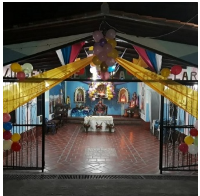
Figura 1. Capilla de Nuestra Señora de la Candelaria

Tenerife, Islas Canarias. Este culto pasó de las Islas Canarias a la Península Ibérica, posteriormente se extiende a América Latina durante el periodo de colonización. Por otra parte, el 02 de febrero es la fecha de culminación del ciclo navideño, siendo específicamente, según el santoral católico, el día de la Presentación del Niño Jesús al templo.