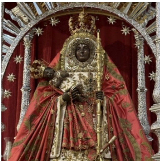
Figura 2. Imagen de la Virgen de la Candelaria, ubicada en Santa Cruz de Tenerife, España