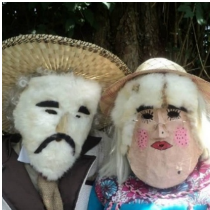
Figura 9. Disfraces del viejo y la vieja , principales personajes de la festividad

El viejo, al igual que la vieja, son los disfraces primordiales, son los representantes, ellos son un equivalentes a los padres de una familia, dirigen a los capitanes y muchachas, y velan por la realización de la venia al Niño Jesús en el pesebre que se encuentra en cada una de las casas que se está visitando, de igual manera se hace una venia o respeto a los miembros de la familia de dicho hogar. El primer y segundo capitán tienen la batuta para dirigir a todas aquellas muchachas para realizar los respectivos bailes en cada casa, dependiendo del espacio que se disponga, es decir si se puede ejecutar algunos de los siguientes bailes: el palito, la contradanza, la cinta, entre otros. Siguiendo la jerarquía, después de los capitanes vienen las muchachas , carolinas y resto de personajes.