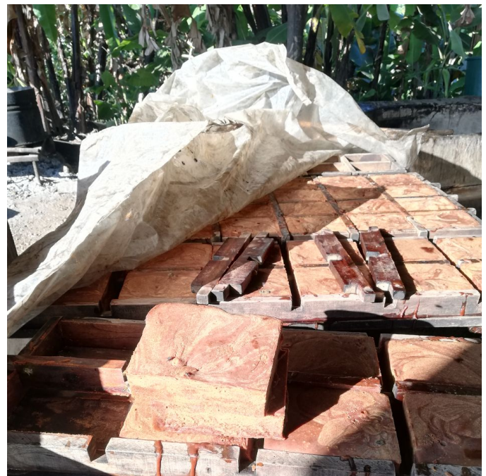
Figura 10. Panela en moldes y herramientas

Tal como se ha notado a lo largo de la descripción anterior, la siembra, molida y procesamiento de la caña implica un arduo trabajo que es realizado en mayor medida por el mantenimiento de la tradición y el terreno, para tener los productos derivados para el uso de la casa y sobre el gusto por el trabajo del campo y su cultivo; más que por los ingresos que genera, debido a que son bajos en comparación con la cantidad de horas de trabajo y el personal que amerita (mínimo 4 personas, dos moliendo y dos en las calderas).