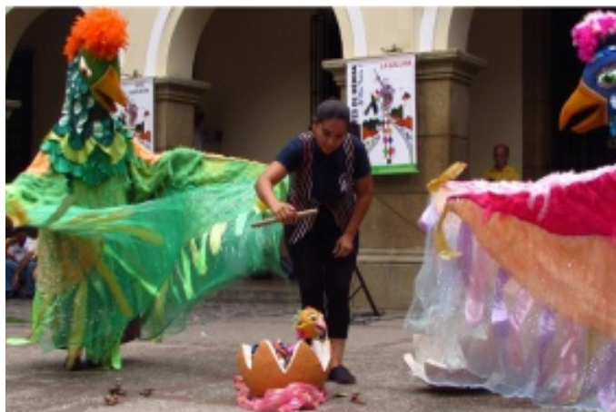
Figura 2. Siete Colores: un arcoíris de emociones en el escenario. Un viaje mágico a través de una historia llena de luz y color

están vinculados por lo general a la falta de presupuesto o recursos económicos que permitan lograr las metas establecidas, así como también para mantener activo el elenco de actores.