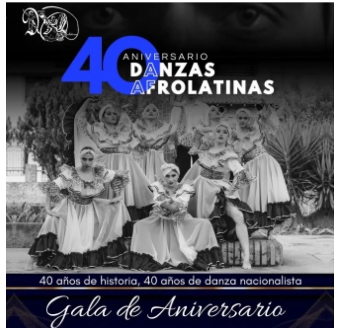
Figura 8. 40 Aniversario de Danzas Afrolatinas

El segundo evento notable en la agenda de Danzas Afrolatinas es la celebración de su aniversario. Este año el grupo conmemora sus 41 años de trayectoria, con actividades planificadas para los días 18 y 19 de octubre, culminando con una misa de acción de gracias el domingo 20. Esta actividad no es solo parte de la historia del grupo, sino que también representa un momento de reflexión y gratitud por el camino recorrido