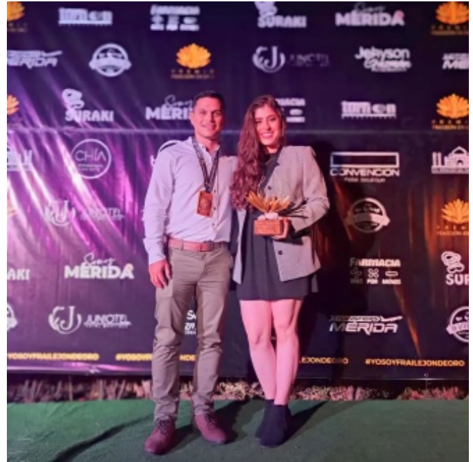
Figura 4. Premio Frailejón de Oro 2023 mención especial a "Danzas Afrolatinas" en honor al maestro Orlando Zerpa

Danzas Afrolatinas es Patrimonio del Municipio Libertador y está en proceso de ser Patrimonio del Estado. Además, su reciente galardón con el Premio Frailejón de Oro en 2023, como agrupación con mejor trayectoria, confirma su lugar destacado en la escena artística nacional, testimonio de su dedicación y visión.