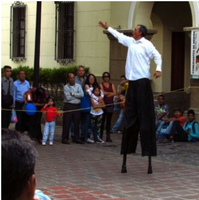
Figura 5. Enseñando valores a nuestros niños a través de las artes escénicas