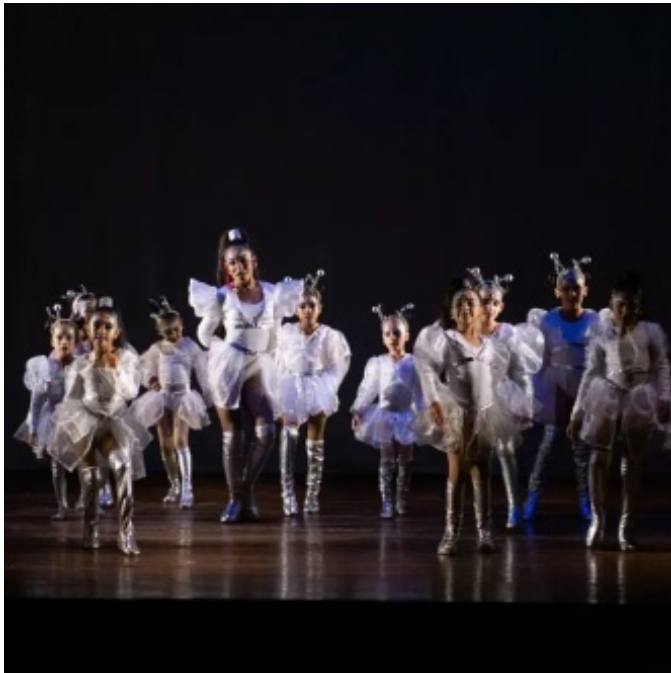
Figura 7. VII Función Venezolana de Niños para Adultos. Junio 2023