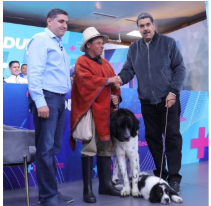
Figura 9. Encuentro con el Presidente Nicolás Maduro y el Gobernador Jehyson Guzmán