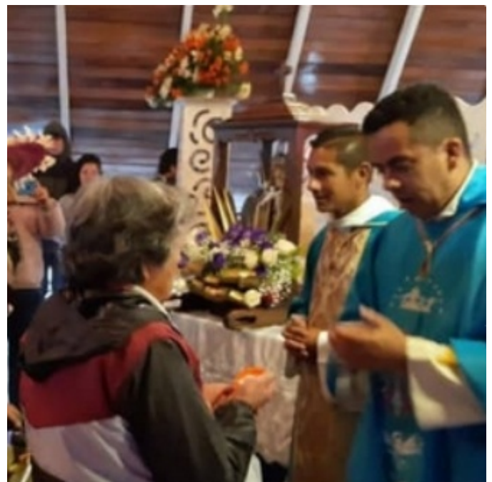
Figura 14. Junta directiva de la cofradía en la iglesia San Isidro Labrador de El Valle