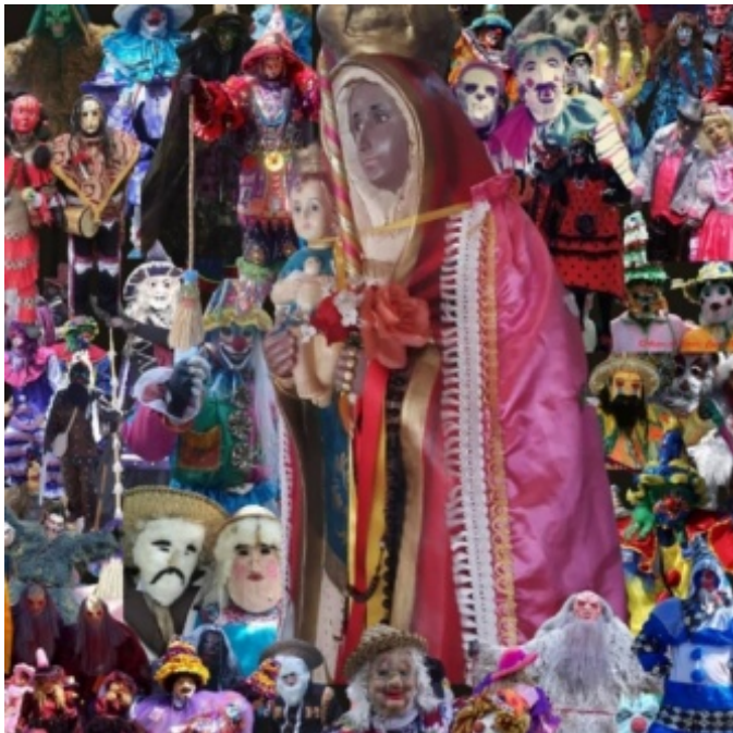
Figura 15. Colección de fotografías alusivas a la festividad de la Virgen de la Candelaria

Además se cuenta con el apoyo adicional de 3 o 4 colaboradores, los polvoreros (personas que detonan fuegos artificiales) y, definitivamente, la presencia de espectadores y devotos, tanto residentes de la comunidad como personas foráneas.