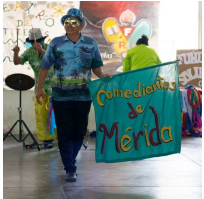
Figura 1. Comediantes de Mérida: entretenimiento que cultiva la creatividad y el pensamiento crítico en los niños y jóvenes

con formas de entretenimiento que ayudan a desarrollar la creatividad y el pensamiento crítico en los niños y jóvenes.