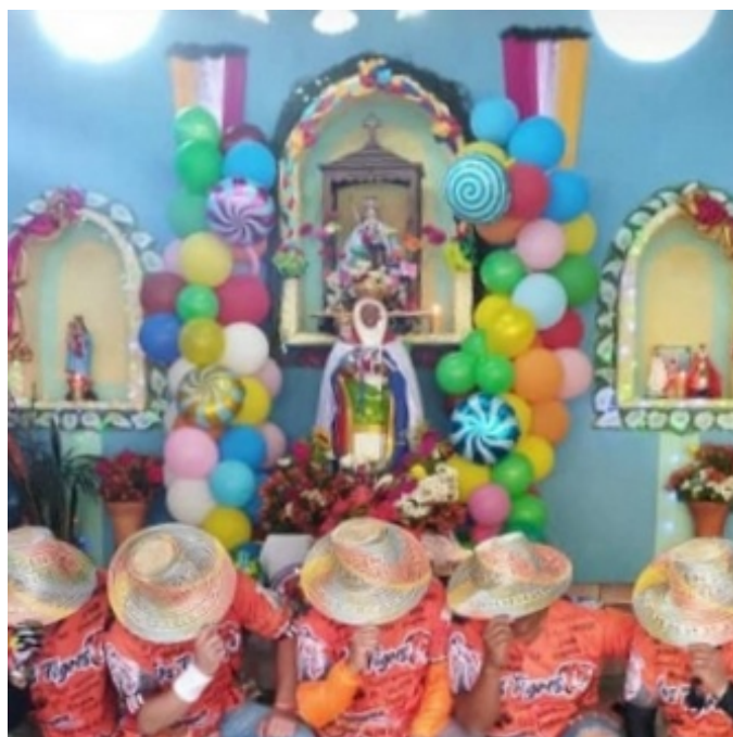
Figura 4. Vasallos de la Virgen de Candelaria al inicio de la jornada