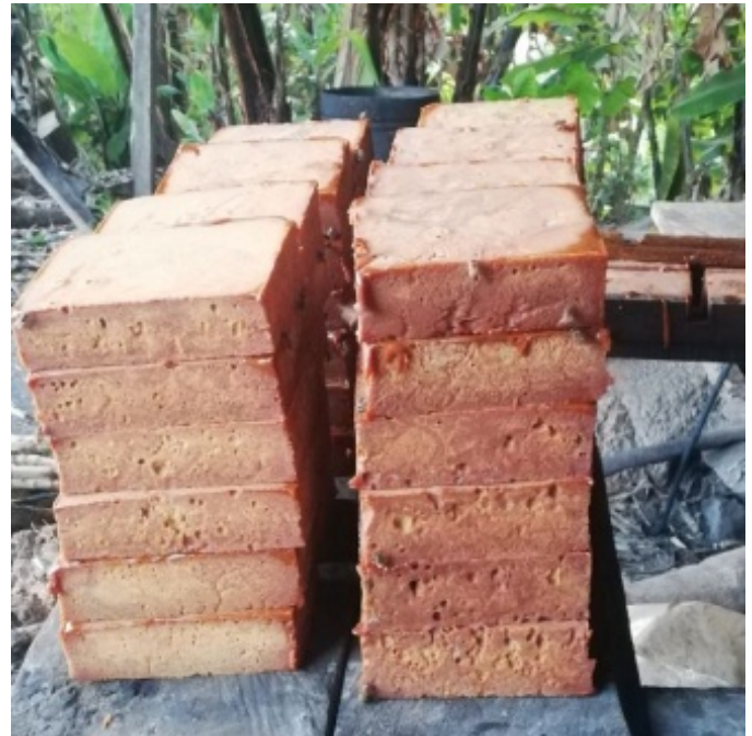
Figura 11. Panela desmoldada