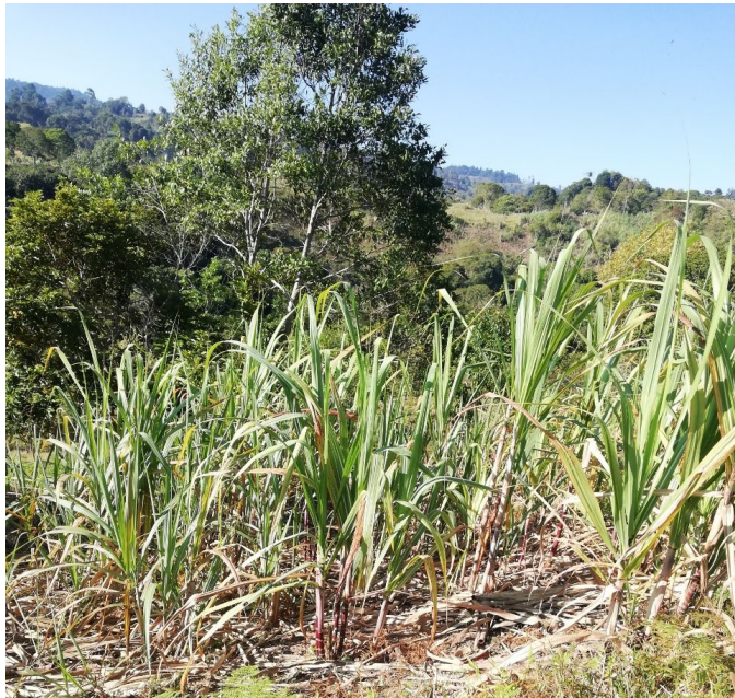
Figura 3. Siembra de caña

trapiche. Generalmente, para una jornada de molienda de un día, se recopila la capacidad de caña de un camión 350, de esta cantidad, al proceder a la extracción del jugo a través de la molienda en el trapiche, salen 8 pacas de panela, cada paca contiene 24, en total serían 192 panelas aproximadamente, además de la miel, sin ningún otro tipo de aditivo.