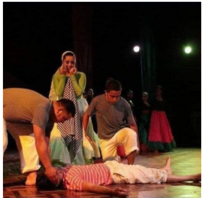
Figura 6. Obra Luis Enrique Cerrada Molina "Machera" Fuente: Anfer Mendoza (2023)

Cada obra coreográfica de Danzas Afrolatinas refleja un compromiso inquebrantable con la preservación de la cultura y la historia de Mérida. El grupo, a través de su arte, ofrece al público un vistazo cautivador a la rica herencia de la región, contribuyendo a fortalecer la identidad local y promover el aprecio por el patrimonio cultural.