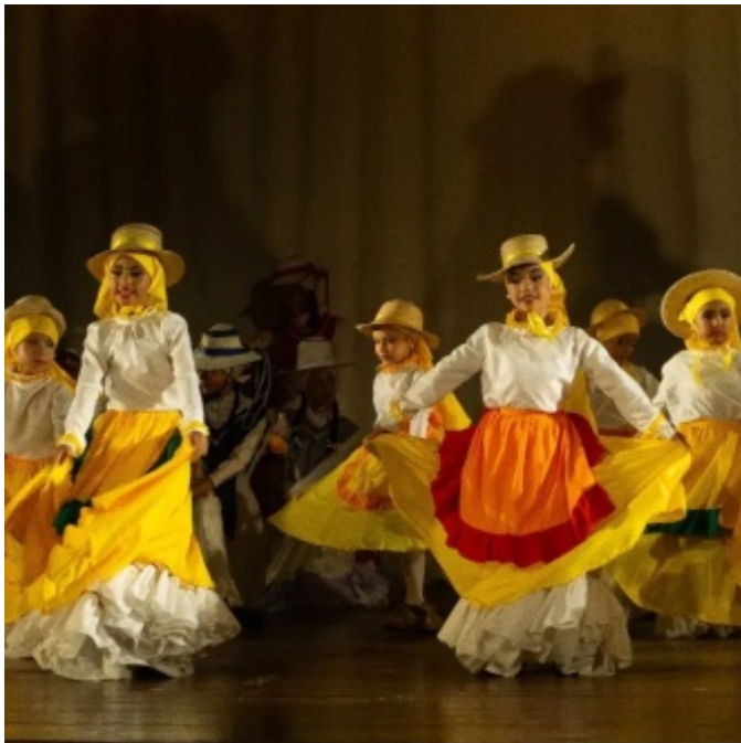
Figura 5. Niños de la Escuela de Formación Artística Danzas Afrolatinas en escena

La proyección de Danzas Afrolatinas trasciende las fronteras locales. La agrupación participa activamente en actos privados, intercambios culturales en el estado Mérida y en diversas regiones de Venezuela, e incluso ha tenido la oportunidad de presentarse en escenarios internacionales. Este enfoque en la formación integral y la diversificación artística refleja el compromiso del grupo con la excelencia y la evolución constante, buscando siempre nuevos retos y oportunidades para seguir creciendo y aportando al mundo de la danza.