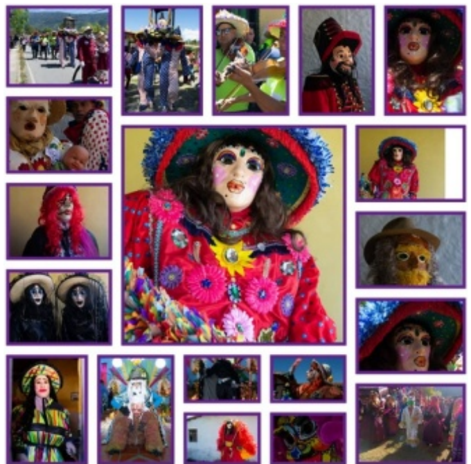
Figura 12. Recopilación de fotografías de disfraces utilizados en la festividad