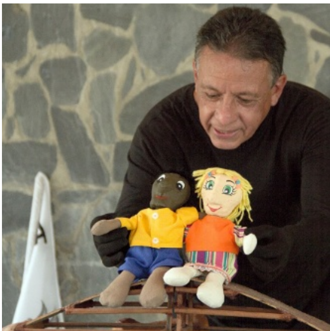
Figura 4. Montaje teatro de bolsillo El puente: un símbolo de unión y esperanza. Construir puentes, no muros: un mensaje de unidad Fuente: Comediantes de Mérida (2024)