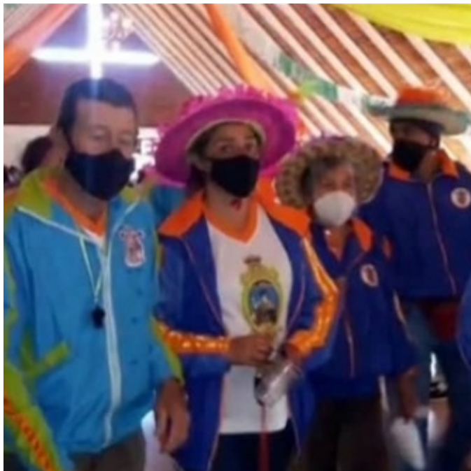
Figura 7. Junta directiva de la festividad de la Virgen de la Candelaria

La festividad en honor a la Virgen de la Candelaria en El