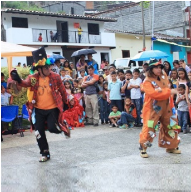
Figura 3. Escenificación de la obra Don Basurón: un mensaje de concienciación y alerta sobre un planeta en peligro