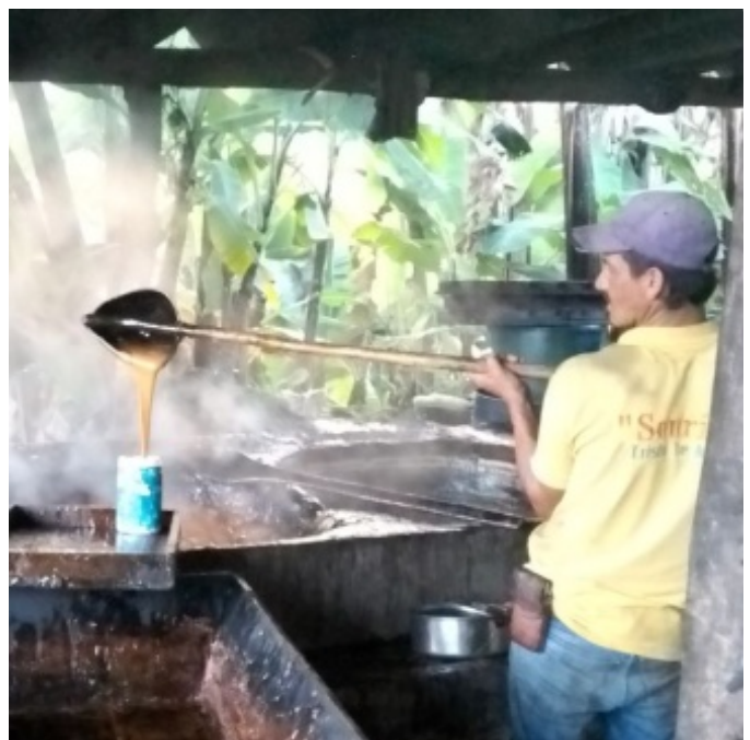
Figura 7. Proceso de elaboración de la miel