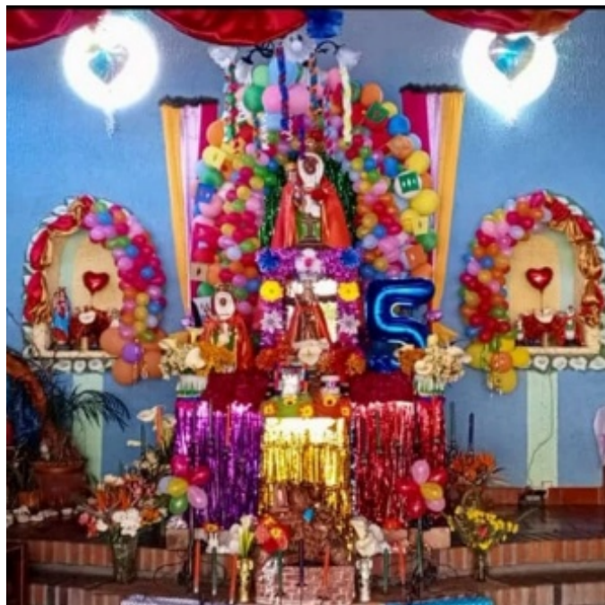
Figura 3. Interior de la capilla de Nuestra Señora de la Candelaria

Es el recorrido que se hace con la imagen de la Virgen de La Candelaria conjuntamente con sus vasallos (de aquí en adelante se utilizará su palabra coloquial, Locos) por los sectores mencionados al principio. Fundamentalmente, durante toda la fiesta, los Locos ejecutan bailes típicos característicos, ataviados con diversos y coloridos