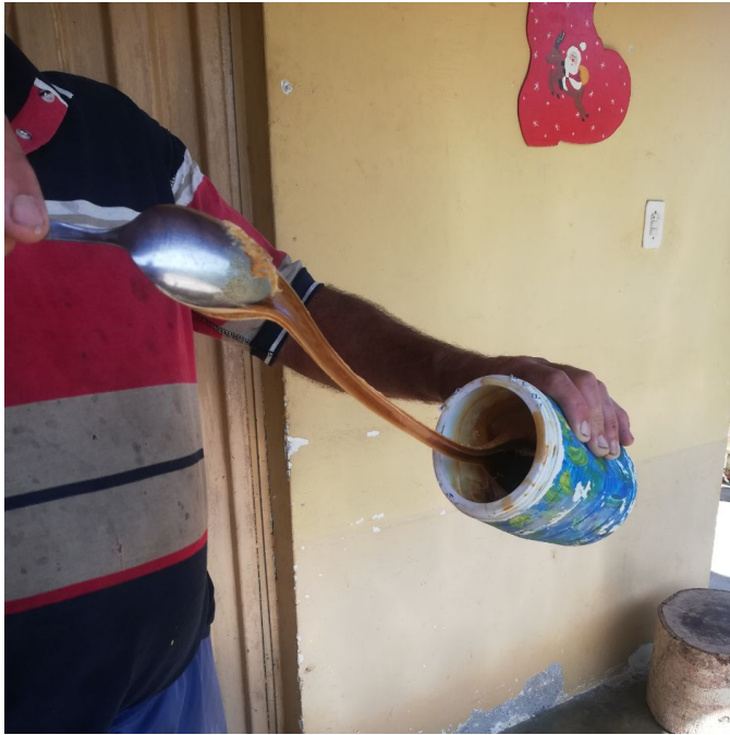
Figura 8. Proceso de elaboración de la melcocha