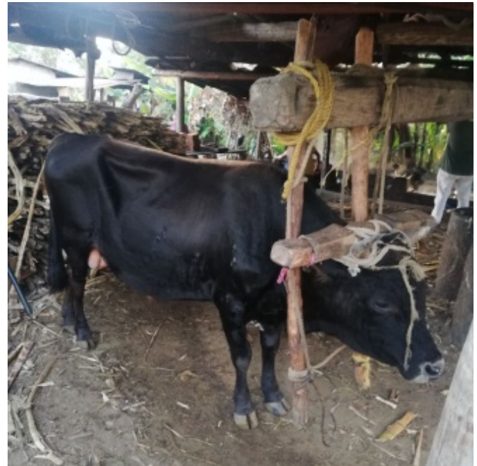
Figura 4. Trapiche artesanal

Para introducir la caña en el trapiche se corta cada caña en trozos de aproximadamente un metro de largo, se le hace un corte diagonal al tallo, de modo que se facilite su introducción entre los rodillos, mientras que del otro lado va saliendo el jugo de la caña y se va depositando en un tanque (pipa). Si la caña es gruesa se va introduciendo de una en una; si es fina de dos o tres simultáneamente.